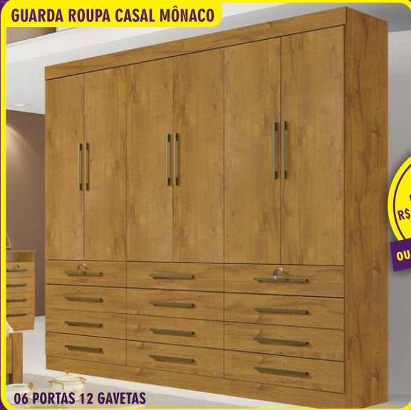
GUARDA ROUPA CASAL MÔNACO