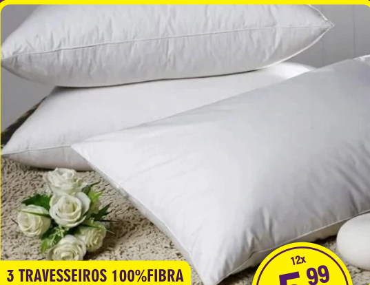
3 TRAVESSEIROS 100% FIBRA