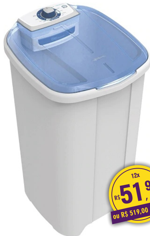
LAVADORA NEWMAQ BRANCA 10KG