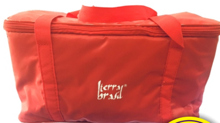
BOLSA TÉRMICA BAG NYLON 33,5 LTS