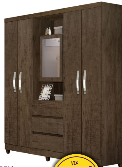
GUARDA ROUPA CAPELINHA