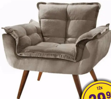
POLTRONA EROS LUXO