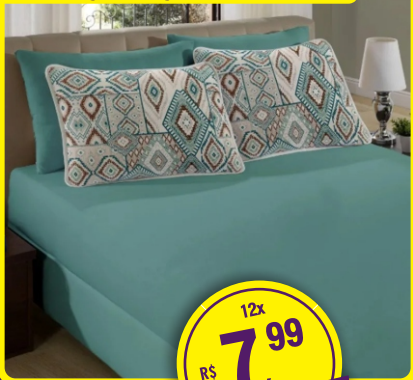
JOGO LENÇOL 3 PEÇAS CASAL SUL BRASIL