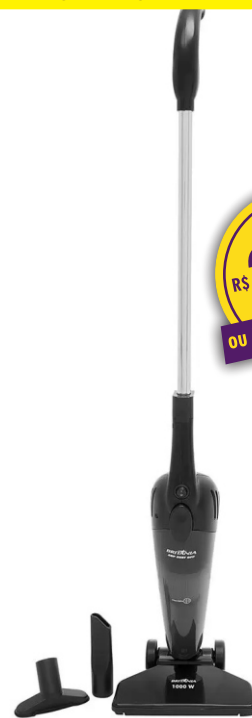
ASPIRADOR DE PÓ BRITÂNIA