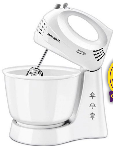
BATEDEIRA MONDIAL (01 PEÇA POR CPF)