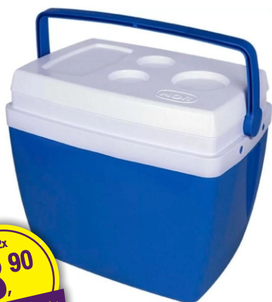
CAIXA TÉRMICA GLACIAL 34 LITROS AZUL