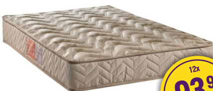
COLCHÃO PAROPAS PAS.138X18 D33 BEGE