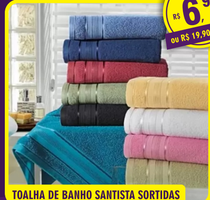
TOALHA DE BANHO SANTISTA SORTIDAS