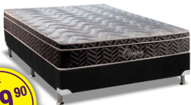
BOX S.BOM + COLCHÃO PAROPAS 138